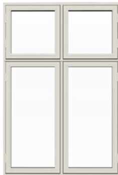
Dannebrogsvindue Sidehængt udadgående åbninger.