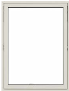
Topstyret vindue Med udadgående åbning.