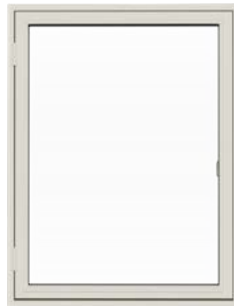
Sidehængt vindue Sidehængt vindue med udadgående åbning.