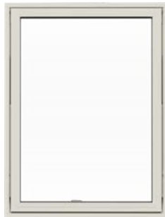
Top/vende vindue Med udadgående åbning.