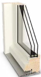
Rammedøre (facade- og terrassedøre)

Vælg din hoveddør med omhu - den skal være indbydende og matche husets stil og sjæl. Sortimentet giver mulighed for at designe en dør, der passer netop til dig og dit hus. STMs facade- og terrassedøre er vel-egnede til såvel nybyggeri som renovering.