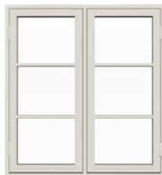
Bondehus vindue Med udadgående åbning.